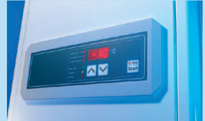
Bedienelement der elektronischen SE-Regelung