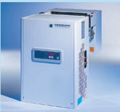
Huckepack-Aggregate mit elektronischer Regelung (wassergekühlt)

Einfache Montage auf dem Dach der Kühlzelle, da die Unterkante des Gerätes plan ist und ein Verschieben auf dem Dach erleichtert. Kein über die Zellengrundfläche hinausgehender Platzbedarf. Mit elektronischer Regelung. In einem Kühlraum können mehrere Aggregate im Busbetrieb vernetzt werden. Kälteleistung für Kühl- und Tiefkühlzellen von 600 bis 2600 W. Luft- oder wassergekühlte Ausführung. Mit Tauwasser-Verdunstung. Kältemittel R 404 A. Fertigung nach EN-Normen, CE-konform.