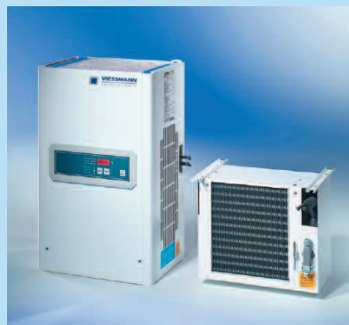
Split-Aggregate mit elektronischer Regelung