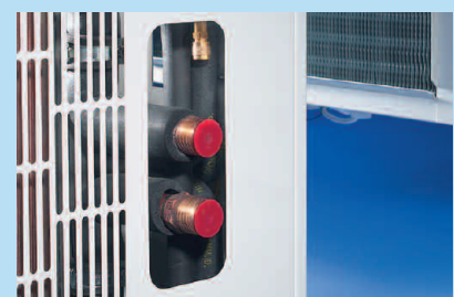
Anschlüsse wassergekühltes Aggregat