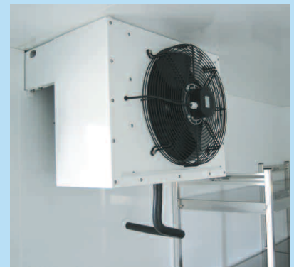
Einbausituation Huckepack-Aggregate (Verdampfer)