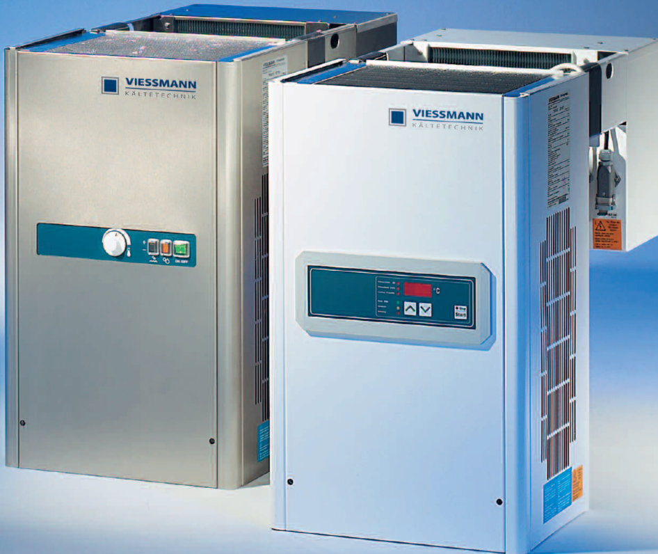
Huckepack-Aggregate mit elektronischer Regelung (vorn) und in Edelstahl ausführung mit thermostatischer Regelung (hinten)