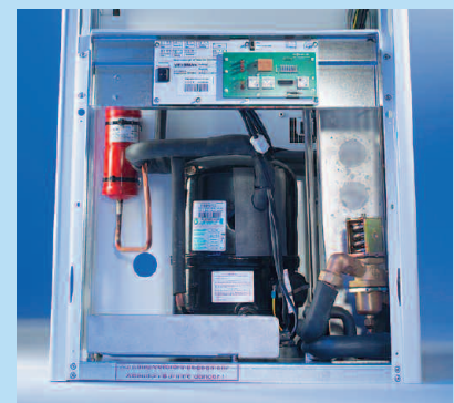
Huckepack-Aggregat (wassergekühlt) offen

* Passwortschutz auf Wunsch oder selbst einstellbar (SD)